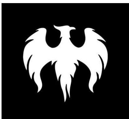
Клуб парламентских дебатов НИ ТГУ