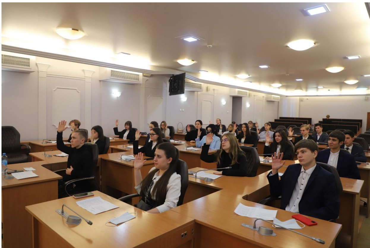
Заседание Детско-юношеского парламента в Думе г.Томска