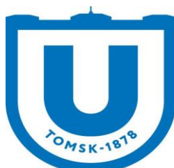
Национальный исследовательский Томский государственный университет