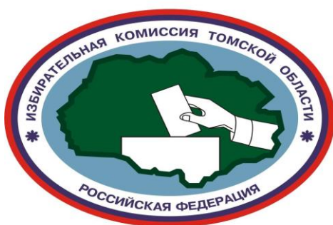
Избирательная комиссия Томской области