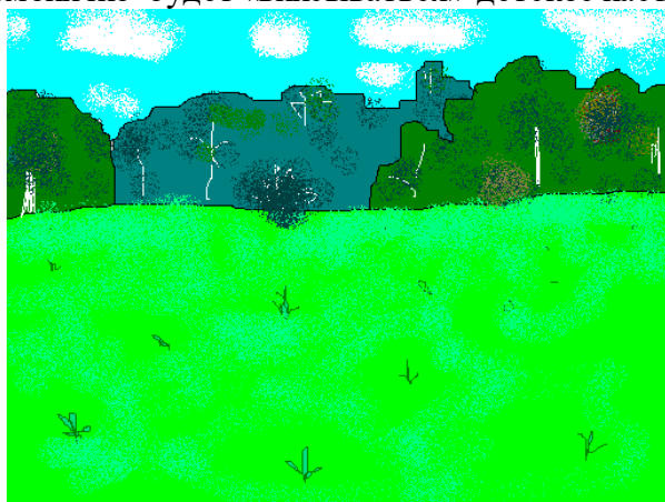
Рис. 10. Экран-иллюстрация.

На рис.10 изображен лесной пейзаж. Символом настроения здесь являются цветы разных оттенков. В зависимости от общего настроения детей картина, словно живая, будет изменяться.